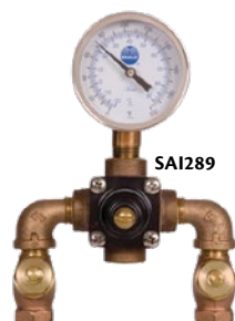
Point de réglage ajustable à l'intérieur de la gamme par une vis de pression à clé hexagonale